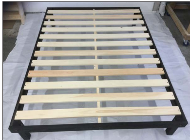
39", 54" et/and 60"

Turn the platform over on its legs. We recommend that 2 people flip the platform to avoid putting strain on the legs at an odd angle.